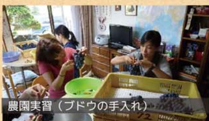
農園実習（ブドウの手入れ）