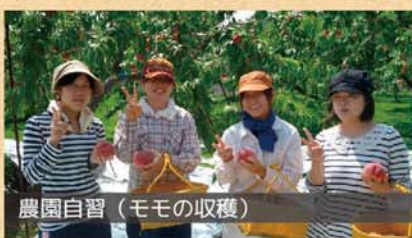
農園自習（モモの収穫）

電話：090-1997-8357 メール：yuichi@satohfarm.com