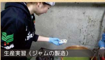
生産実習（ジャムの製造）