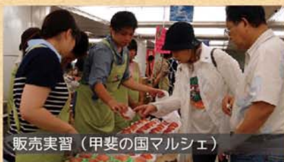
販売実習（甲斐の国マルシェ）